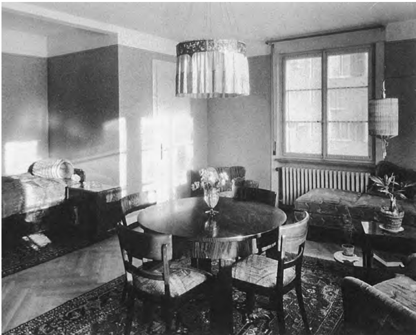
▲ 6 Der Wohnbereich mit Schlafnische einer Einzimmerwohnung Südecke Brückenstrasse 59 ...