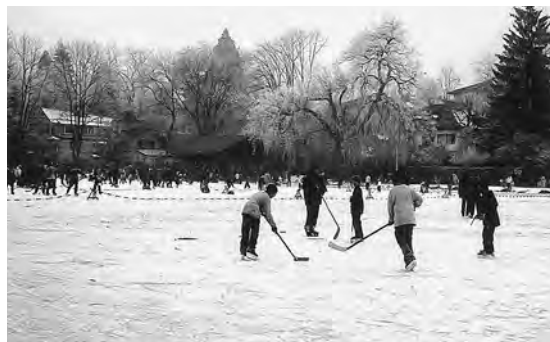
▲ 2 Reger Winterbetrieb auf dem zugefrorenen Egelmöslisee inmitten des Siedlungsgebiets im Südosten Berns. Jan. 2002.