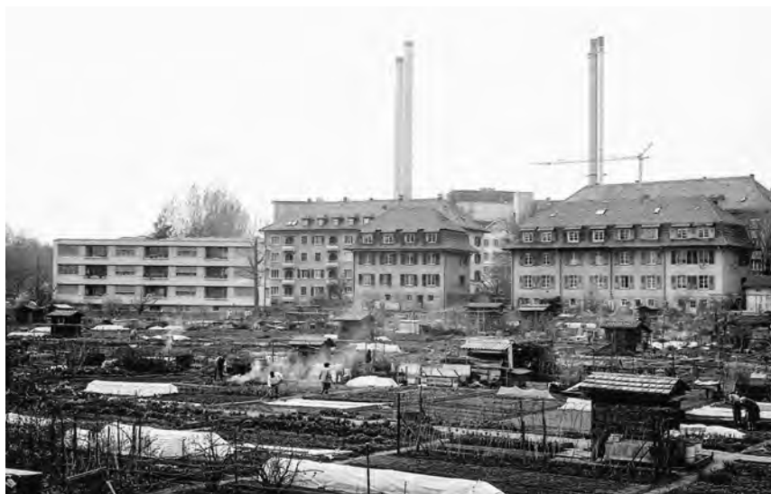
▲ 6 Schrebergärten zwischen Schloss- und Mutachstrasse in Holligen, wo sich heute die Siedlung Huebergass befindet. Im Hintergrund die Hochkamine der Kehrlichtverbrennung, an deren Stelle heute die Überbauung Holligerhof kurz vor Vollendung steht. Apr. 1986.