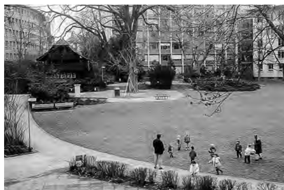
▼ 3 Der Monbijoupark mit einem hölzernen Speicher aus dem 18. Jh. als gründergebliebener Teil des einstigen Landguts Monbijou, flankiert von den Hochbauten des Radiostudios und der Oberzolldirektion. Febr. 1996.