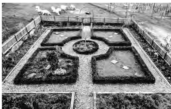
◀ 8 Liebevoll gepflegter Bauerngarten in der Nachbarschaft des Schlosses von Worb mit symmetrisch angelegten, von Buchsbaumhecken umrandeten Beeten. März 2023.