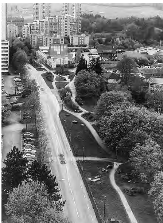
▲ 5 Promenade mit Findlingen auf dem Gebiet der alten Murtenstrasse entlang des Tscharnerguts zwischen der Mauritius-Kirche und dem Acherli-Wohnheim. Mai 1998.